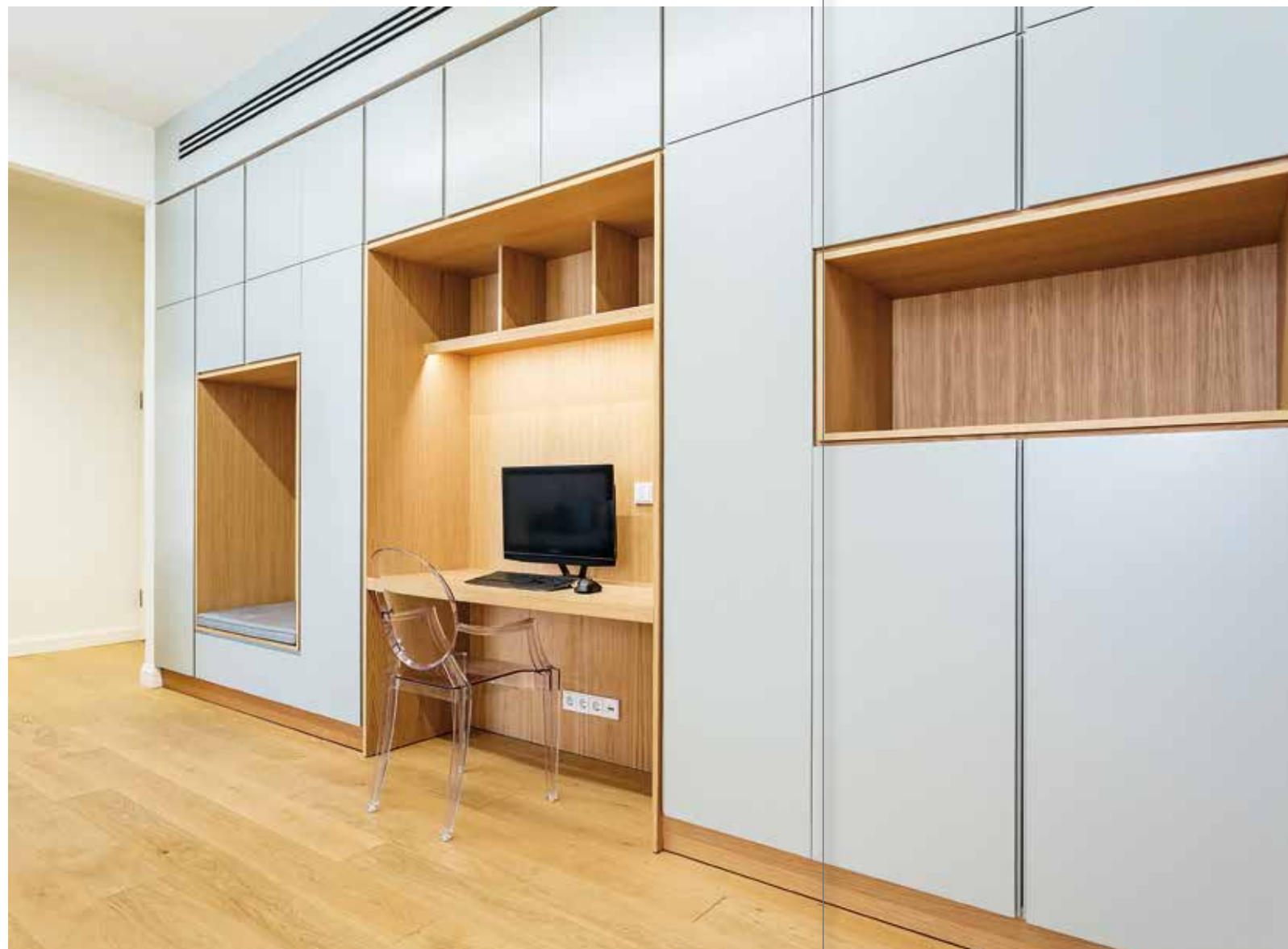
ΜΕΣΑ ΑΠΟ ΕΝΑ ΔΙΑΛΟΓΟ ΚΕΝΟΥ ΚΑΙ ΠΛΗΡΟΥΣ ΔΗΜΙΟΥΡΓΕΙΤΑΙ ΜΙΑ ΣΥΝΘΕΣΗ ΑΠΟΘΗΚΕΥΤΙΚΩΝ ΧΩΡΩΝ, ΣΕ ΙΣΟΡΡΟΠΙΑ ΜΕ ΤΗΝ ΚΑΛΥΨΗ ΛΕΙΤΟΥΡΓΙΚΩΝ ΑΝΑΓΚΩΝ, ΟΠΩΣ ΤΟ ΒΕΣΤΙΑΡΙΟ ΤΩΝ ΕΠΙΣΚΕΠΤΩΝ, ΕΝΑ ΜΙΚΡΟ ΓΡΑΦΕΙΟ ΚΑΙ ΕΝΑΣ ΠΑΓΚΟΣ.