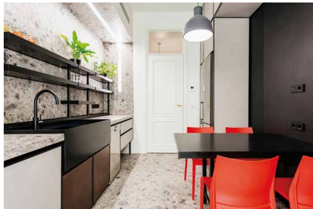
Η ΚΟΥΖΙΝΑ ΔΙΑΜΟΡΦΩΘΗΚΕ ΣΕ ΔΥΟ ΒΑΣΙΚΕΣ ΛΕΙΤΟΥΡΓΙΚΕΣ ΖΩΝΕΣ, ΚΑΤΑ ΜΗΚΟΣ ΤΗΣ ΜΕΓΑΛΥΤΕΡΗΣ ΠΛΕΥΡΑΣ ΤΟΥ ΧΩΡΟΥ.

Η χρήση του χρώματος περιορίστηκε σε δύο μόνο σημεία του διαμερίσματος και συνδυάστηκε με γύψινα διακοσμητικά πλαίσια: στον τοίχο του καθιστικού και στον τοίχο του κυρίως υπνοδωματίου, αντικαθιστώντας το κεφαλάρι. Συμπληρωματικά, το χρώμα επισημαίνει την παρουσία του και σε ορισμένα έπιπλα, όπως στις καρέκλες της τραπεζαρίας και της κουζίνας. Η χρωματική πρόταση διαβαθμίζεται μεταξύ θερμών (κόκκινων - ροζ) και ψυχρών (μπλε - πετρόλ) αποχρώσεων. Ωστόσο, η μεγαλύτερη τονική ένταση των χώρων προκύπτει από το "διάλογο" των εκτεταμένων λευκών επιφανειών και των μαύρων λεπτομερειών της επίπλωσης. Σημαντικό στοιχείο, που συμπληρώνει την παλέτα των υλικών, ενώ παράλληλα προσδίδει πολυτέλεια και διαχρονικότητα στους χώρους, είναι ο μπρούτζος, ο οποίος χρησιμοποιείται ως λεπτομέρεια στην επίπλωση, καθώς και στα μίνιμαλ, γεωμετρικά φωτιστικά.