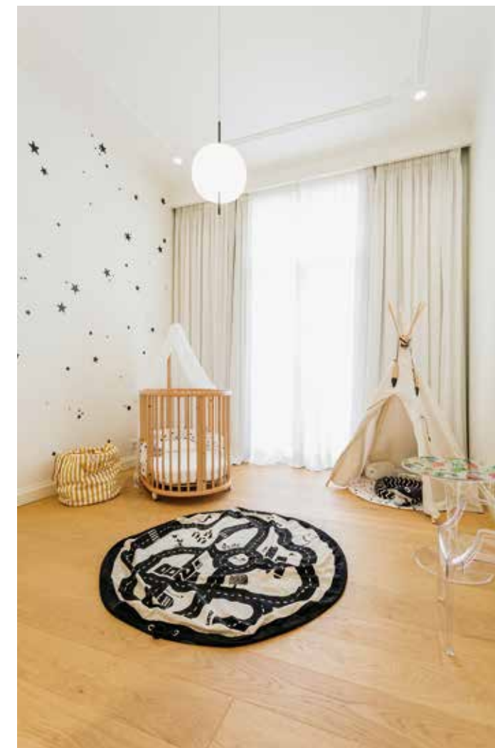
ΣΤΑ ΔΑΠΕΔΑ ΚΥΡΙΑΡΧΕΙ ΤΟ ΞΥΛΟ, ΜΕ ΔΡΥΙΝΕΣ ΠΛΑΤΙΕΣ ΣΑΝΙΔΕΣ, ΣΤΗ ΦΥΣΙΚΗ ΤΟΥΣ ΑΠΟΧΡΩΣΗ.