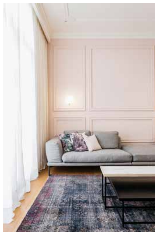
ΑΙΣΘΗΤΙΚΗ ΚΑΤΕΥΘΥΝΣΗ ΤΟΥ ΣΧΕΔΙΑΣΜΟΥ ΑΠΟΤΕΛΕΣΕ Η "ΑΝΑΒΙΩΣΗ" ΑΥΘΕΝΤΙΚΩΝ, ΚΛΑΣΙΚΩΝ ΣΤΟΙΧΕΙΩΝ ΤΟΥ ΚΤΙΡΙΟΥ, ΟΠΩΣ ΤΩΝ ΓΥΨΙΝΩΝ ΔΙΑΚΟΣΜΗΤΙΚΩΝ ΣΤΟΙΧΕΙΩΝ ΣΤΗΝ ΟΡΟΦΗ ΚΑΙ ΣΤΟΥΣ ΤΟΙΧΟΥΣ.

Ο χώρος διημέρευσης οργανώθηκε κατάλληλα σε επί μέρους ζώνες καθιστικού και τραπεζαρίας, διαχωρισμένους μεταξύ τους με μεταλλική βιβλιοθήκη. Το λουτρό και το WC επισκεπτών παρέμειναν στις ίδιες θέσεις, δίνοντας περισσότερο χώρο στο λουτρό και περιορίζοντας το WC στις ελάχιστες λειτουργικές διαστάσεις. Η κουζίνα