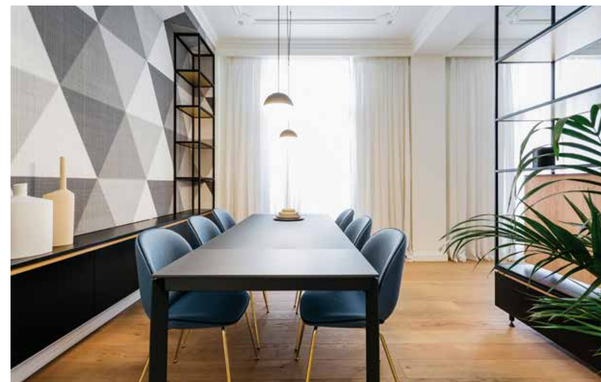
Η ΒΑΣΙΚΗ ΔΙΑΤΑΞΗ ΤΩΝ ΧΩΡΩΝ ΔΙΑΤΗΡΗΘΗΚΕ ΚΑΙ ΒΕΛΤΙΩΘΗΚΕ ΜΕ ΠΑΡΕΜΒΑΣΕΙΣ ΜΙΚΡΗΣ ΚΛΙΜΑΚΑΣ, ΜΕ ΣΤΟΧΟ ΤΗΝ ΠΡΟΣΑΡΜΟΓΗ ΤΟΥΣ ΣΤΙΣ ΣΥΓΧΡΟΝΕΣ ΑΝΑΓΚΕΣ.