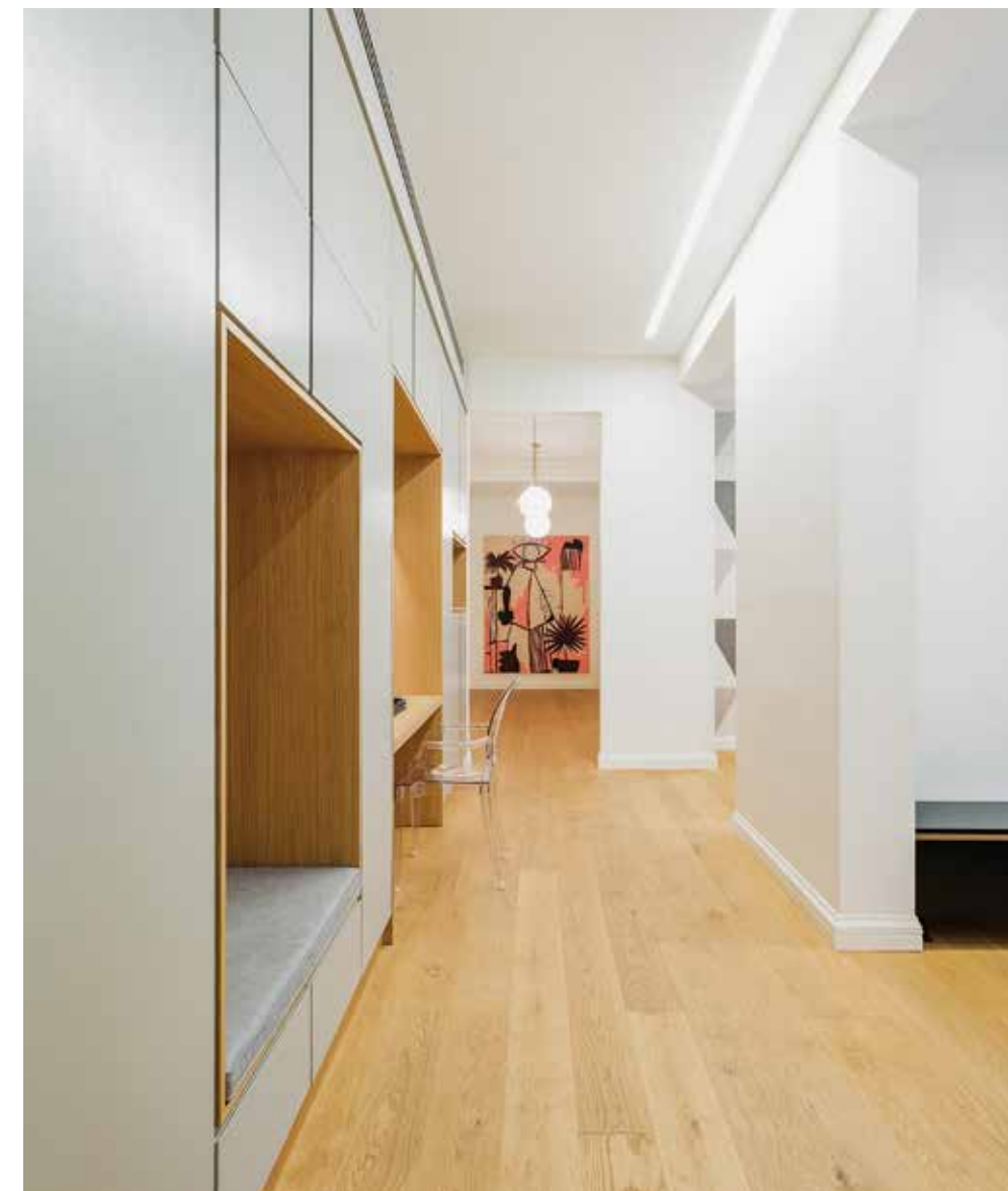
ΚΑΤΑ ΜΗΚΟΣ ΤΟΥ ΚΕΝΤΡΙΚΟΥ ΔΙΑΔΡΟΜΟΥ ΟΡΓΑΝΩΘΗΚΑΝ ΟΙ ΒΑΣΙΚΕΣ ΧΡΗΣΕΙΣ ΑΠΟΘΗΚΕΥΣΗΣ.

Το διαμέρισμα βρίσκεται στον τρίτο όροφο ιστορικού, διατηρητέου κτιρίου, στο κέντρο της Θεσσαλονίκης. Λίγα χρόνια πριν από την ανακαίνιση του διαμερίσματος είχε πραγματοποιηθεί αποκατάσταση στις όψεις αλλά και εσωτερικά, στους κοινόχρηστους χώρους του κτιρίου. Στο συγκεκριμένο διαμέρισμα είχαν καθαριστεί εσωτερικά τα δάπεδα, τα εσωτερικά κουφώματα, κάθε είδος επένδυσης, καθώς και τα αυθεντικά γύψινα διακοσμητικά στοιχεία.